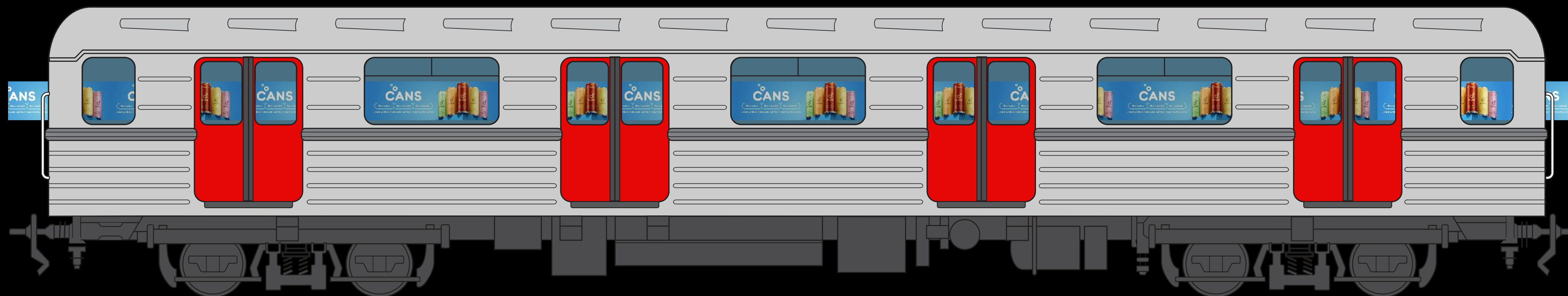
Přibližná ukázka zobrazení ve třetím voze soupravy